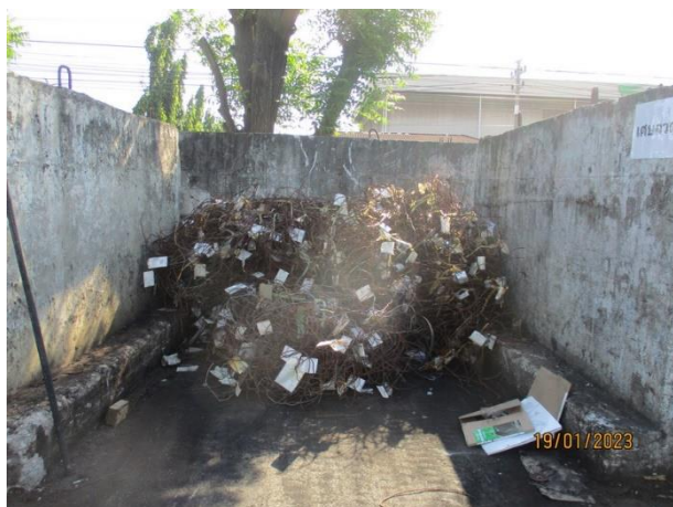
รูปที่ 2-15 เศษเหล็ก ในพื้นที่เก็บเศษเหล็ก