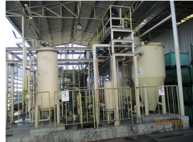
รูปที่ 2-5 ระบบบำบัดน้ำเสียทางเคมี