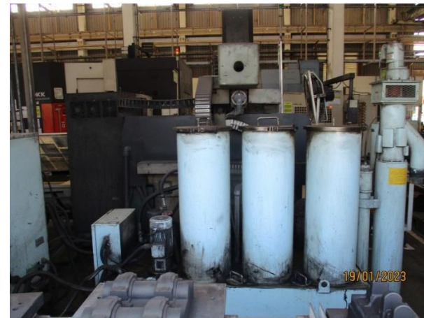
รูปที่ 2-42 ระบบกรองน้ำมัน (Oil filter) ในขณะซึบน้ำมันกันสนิม