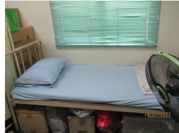
เตียงคนไข้