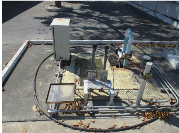
บ่อพักน้ำทิ้ง (ก่อนระบายไปยัง Sump pit 1)