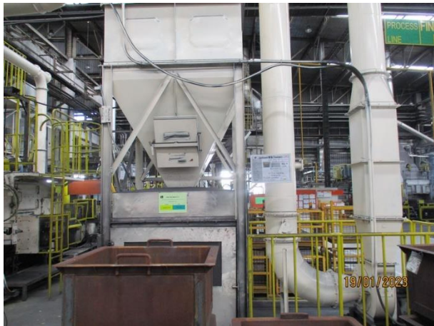
รูปที่ 2-39 Big bag เพื่อรองรับฝุ่นละอองจากการเคาะฝุ่นออกเป็นจังหวะของระบบถุงกรองของเครื่องขัดผิวชิ้นงาน และมีตัวปิดมิดชิด