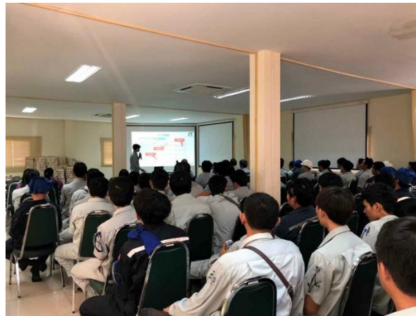
รูปที่ 2-52 การจัดฝึกอบรมให้ความรู้พนักงานเกี่ยวกับอันตรายจากเสียงดังและการสวมใส่อุปกรณ์ป้องกันอันตรายต่อการได้ยินที่มีประสิทธิภาพ