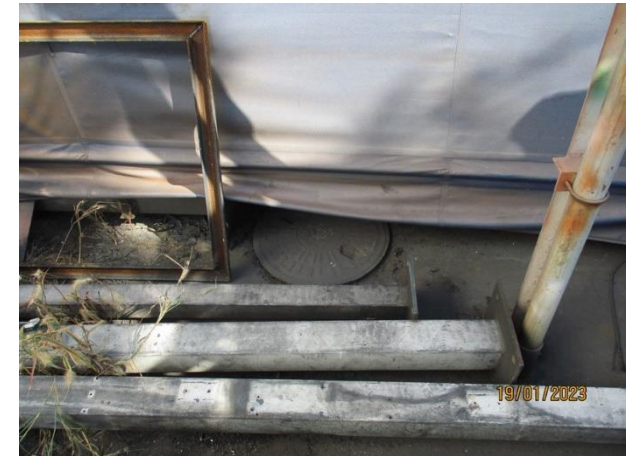
รับน้ำเสียจากห้องน้ำ-ห้องส้วมส่วนตรวจสอบผลิตภัณฑ์