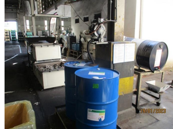
รูปที่ 2-51 การเปลี่ยนถ่ายน้ำมัน มีภาชนะรองรับที่มีฝาปิดมิดชิด