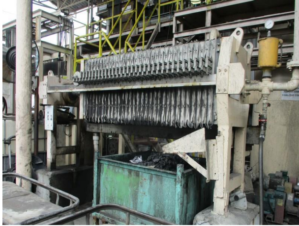
รูปที่ 2-50 พาเลทรองรับการรีดตะกอนจากระบบบำบัดน้ำเสียทางเคมี