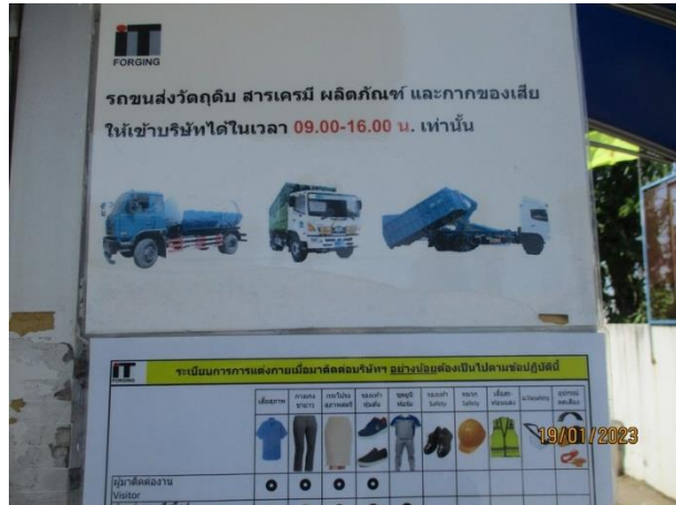
รูปที่ 2-27 ป้ายจำกัดเวลาขนส่งวัสดุหิน สารเคมี ผลิตภัณฑ์ และกากของเสีย