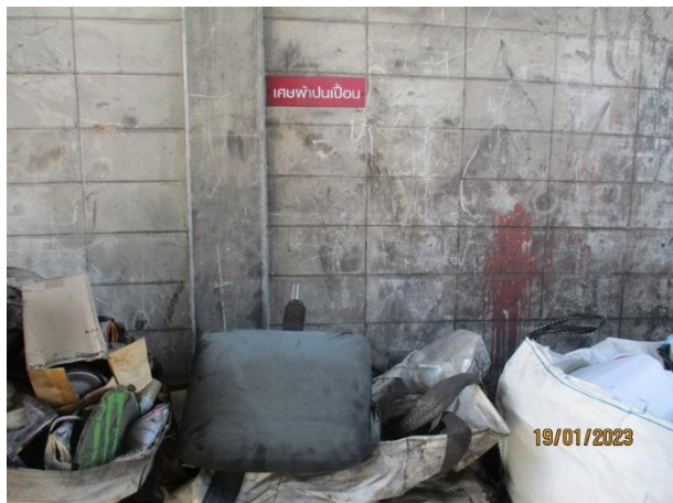
รูปที่ 2-23 เศษผ้า/ถุงมือปนเปื้อนน้ำมัน รวบรวมภายในโรงเก็บขยะ