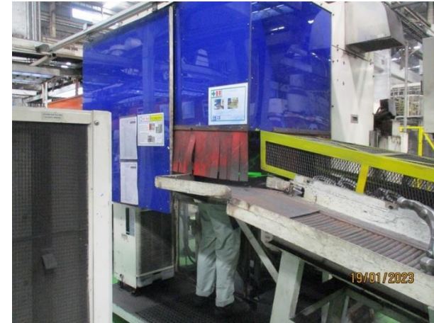
รูปที่ 2-46 การติดตั้ง Photo sensor เพื่อป้องกันเครื่องจักรหนีบ/กระแทก เกิดอันตรายกับพนักงานทำงานกับเครื่องตรวจสอบรอยร้าว