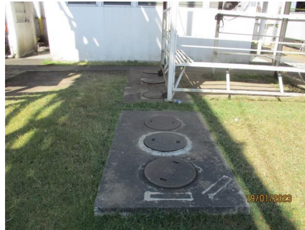
รับน้ำเสียจากห้องน้ำ-ห้องส้วมส่วนอบชุบชิ้นงาน