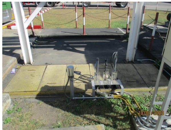
Cooling water return pit 1