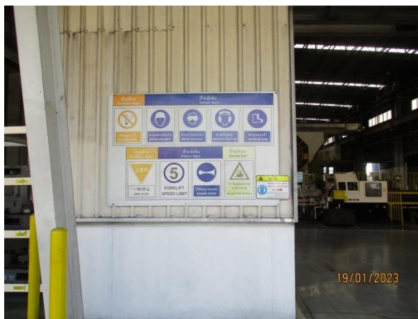
รูปที่ 2-3 ติดป้ายห้าม ป้ายบังคับ และป้ายเตือน การสวมใส่ PPE บริเวณก่อนเข้าอาคารผลิต