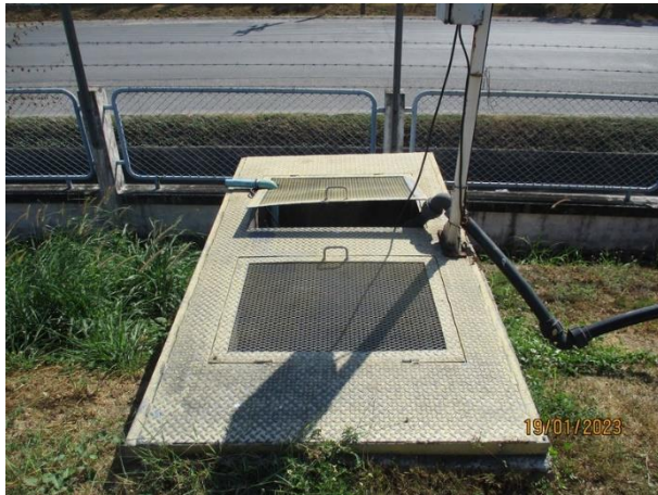
Sump pit 3