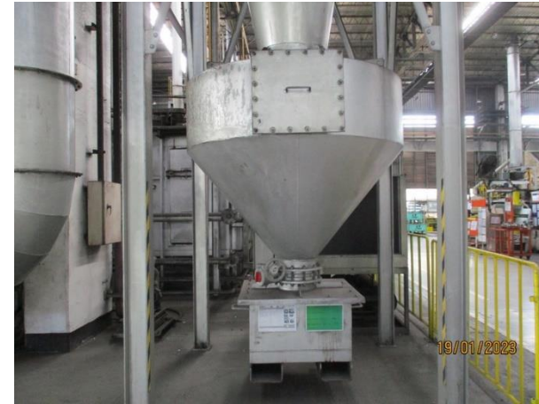
รูปที่ 2-38 Big bag เพื่อรองรับฝุ่นละอองจาก Cyclone และมีตัวปิดมิดชิด เพื่อป้องกันการฟุ้งกระจาย