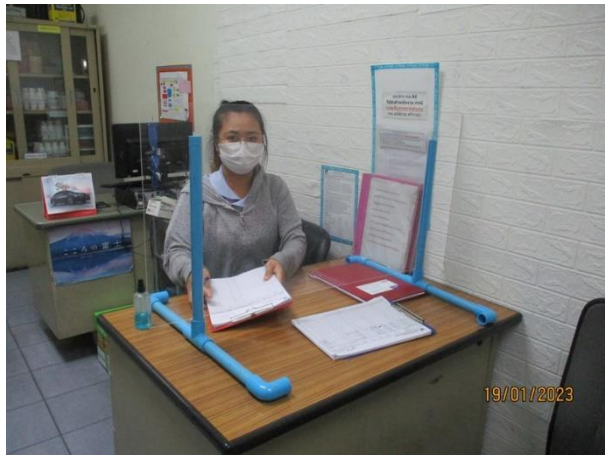
เจ้าหน้าที่ประจำห้องพยาบาล