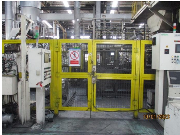
รูปที่ 2-47 การติดตั้งรั้วล้อมรอบบริเวณหุ่นยนต์แขนกลสำหรับหยิบชิ้นงาน และมีระบบ Safety plugs