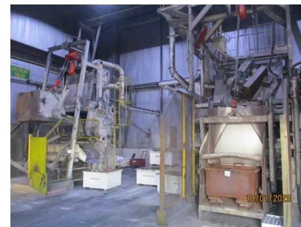
รูปที่ 2-36 ย้ายเครื่องจักรขึ้นงาน (แบบถ้ำ) ออกจากอาคารผลิต 1