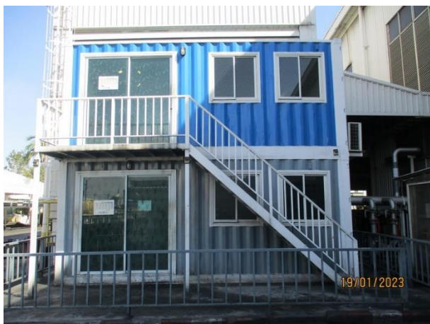
รูปที่ 2-32 ห้องพักงานของพนักงานในแผนกทุบขึ้นรูป