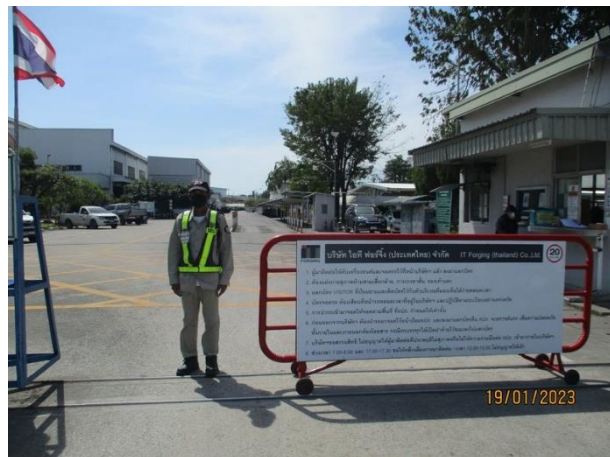
รูปที่ 2-29 เจ้าหน้าที่อำนวยความสะดวกและจัดระเบียบรถเข้า-ออกในพื้นที่โครงการ