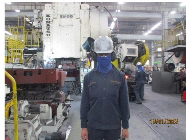
รูปที่ 2-2 พนักงานสวมใส่อุปกรณ์ป้องกันอันตรายส่วนบุคคลที่สามารถป้องกันอันตรายจากเสียงดัง