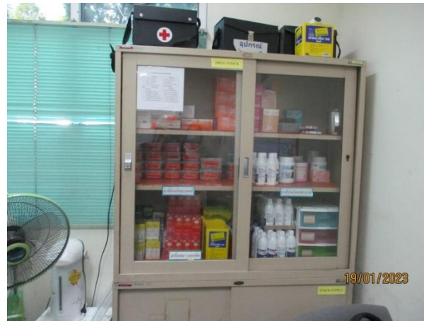
ตู้จัดเก็บเวชภัณฑ์