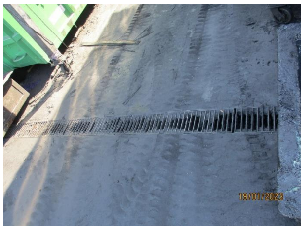
รูปที่ 2-25 รางดักน้ำมันบริเวณด้านหน้าของโรงเก็บขยะ (ภายใต้หลังคา)