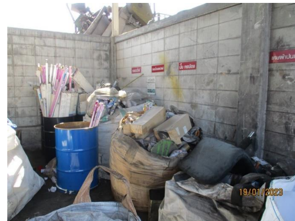
รูปที่ 2-14 โรงเก็บขยะอันตราย