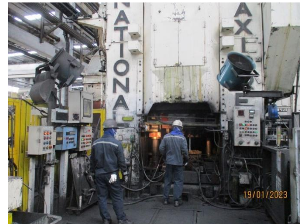
รูปที่ 2-31 ติดตั้งพัดลมระบายอากาศให้กับพนักงานที่ต้องปฏิบัติงานบริเวณเครื่องทุบขึ้นรูป