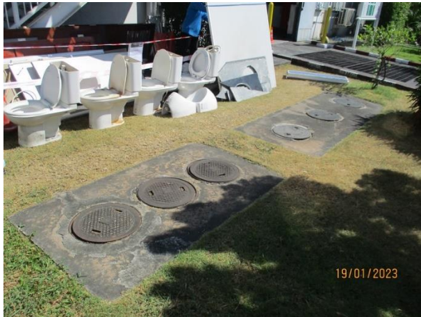
รับน้ำเสียจากห้องน้ำ-ห้องส้วมโรงแม่พิมพ์