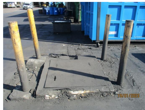
รูปที่ 2-26 บ่อดักน้ำมันขนาด 1.5 ลูกบาศก์เมตร