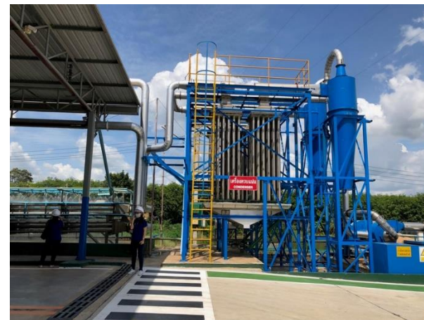
รูปที่ 2-11 การตรวจประเมินผู้รับกำจัดของเสีย