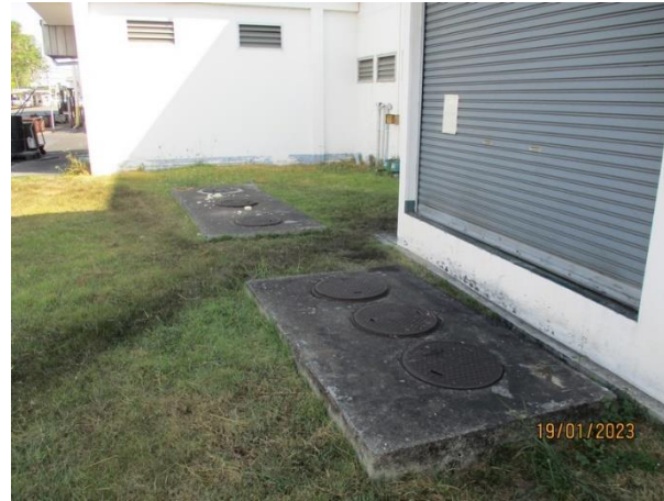
รับน้ำเสียจากห้องน้ำ-ห้องส้วมส่วนทุบขึ้นรูป 1