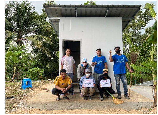
โครงการ สร้างห้องน้ำให้ชุมชน