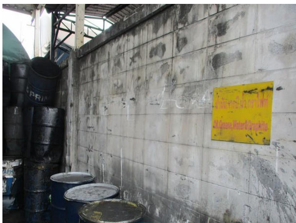
รูปที่ 2-43 ภาชนะรองรับการถายน้ำมัน ที่มีฝาปิดมิดชิด และเคลื่อนย้ายไปเก็บที่โรงเก็บของเสียอันตรายพร้อมติดป้ายชี้บ่ง