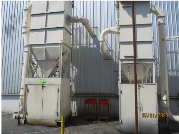
รูปที่ 2-37 ระบบบำบัดมลพิษทางอากาศแบบถุงกรอง ของเครื่องขัดผิวชิ้นงาน