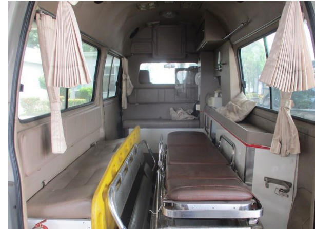
รูปที่ 2-56 รถพยาบาล