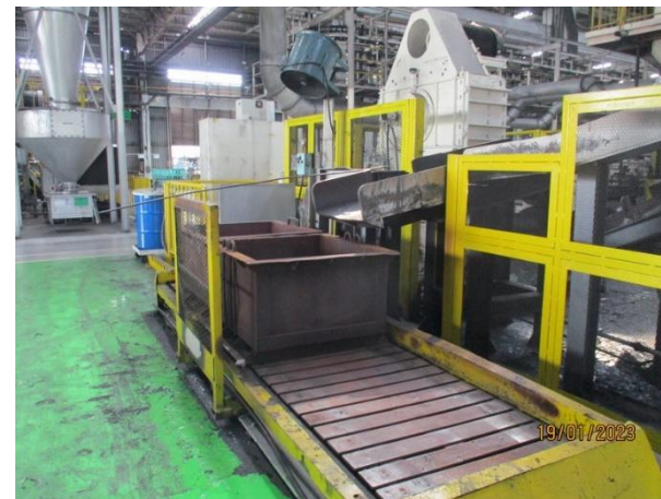
รูปที่ 2-35 ฐานรองเพื่อลดความสูงของรางลำเลียงชิ้นงานที่ออกจากขั้นตอนการผลิตลงสู่กระบะเหล็กรองรับชิ้นงาน