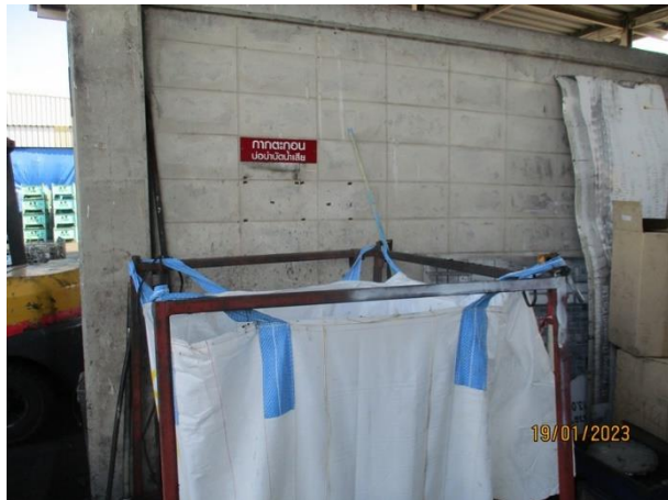
รูปที่ 2-17 ตะกอนจากระบบบำบัดน้ำเสีย ในโรงเก็บขยะ