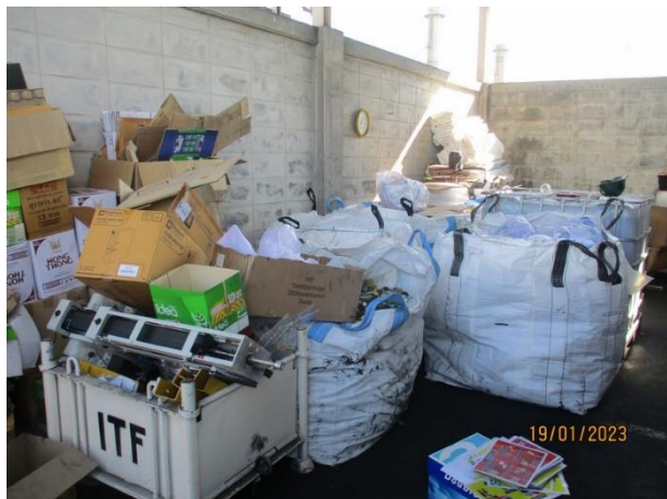
รูปที่ 2-13 โรงเก็บขยะรีไซเคิล