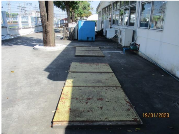
รับน้ำเสียจากโรงอาหารและห้องอาบน้ำ