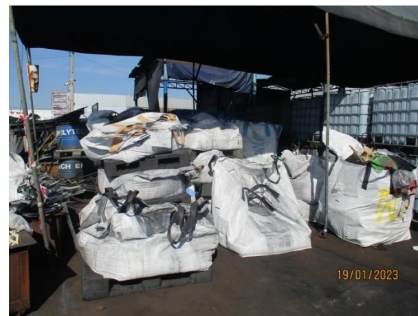
รูปที่ 2-22 ฝุ่นละอองและเม็ดเหล็กเสื่อมสภาพจัดเก็บใน Big Bag รวบรวมภายในโรงเก็บขยะ