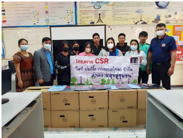
โครงการ มอบคอมพิวเตอร์ให้โรงเรียน