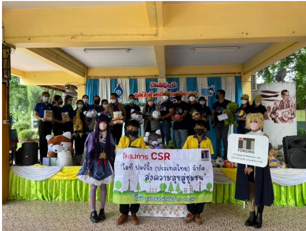
โครงการมอบน้ำเย็นให้โรงเรียน