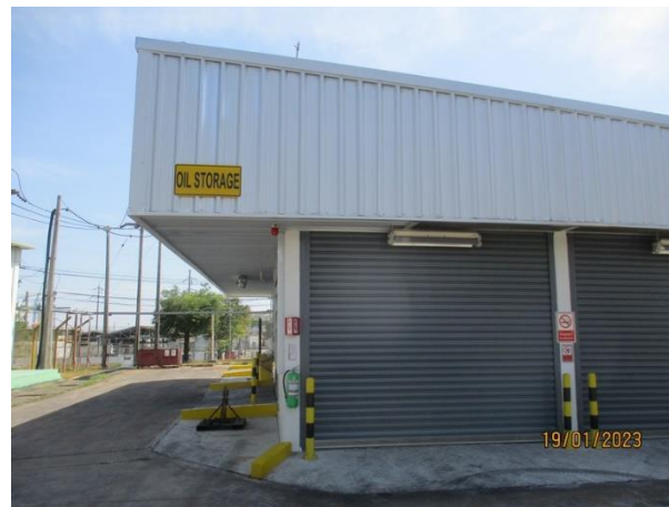
รูปที่ 2-49 การจัดเก็บสารเคมีไว้ในอาคารที่มีหลังคาปกคลุม เพื่อป้องกันการรั่วไหลลงสู่ทางระบายน้ำฝน