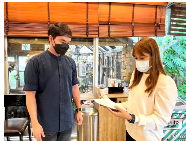
รูปที่ 2-54 กิจกรรมส่งความสุขสู่ชุมชน