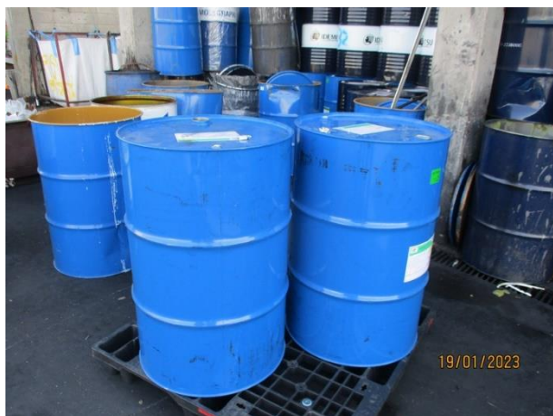
รูปที่ 2-21 น้ำมันเสื่อมสภาพ ในโรงเก็บขยะ