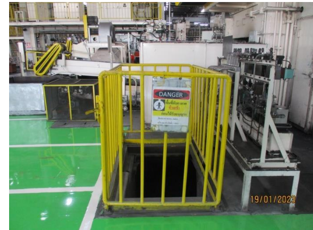
รูปที่ 2-18 ป้อนกรรตเก็บน้ำปนเปื้อนน้ำมันใต้เครื่องทุบขึ้นรูป