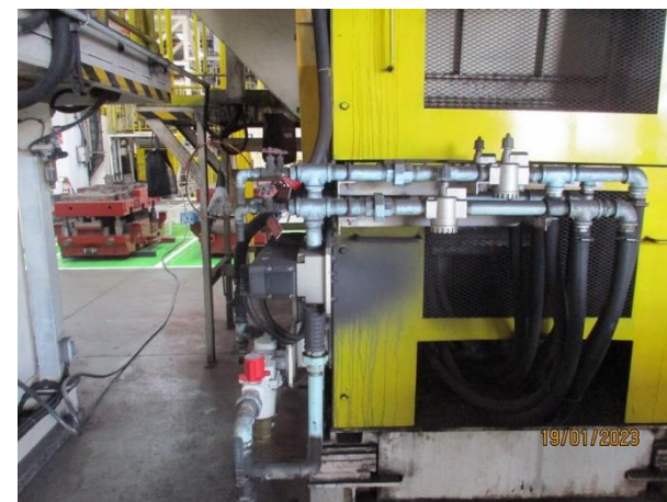
รูปที่ 2-33 Silencer ที่วาล์วควบคุมกระบอกลมเครื่องทุบ