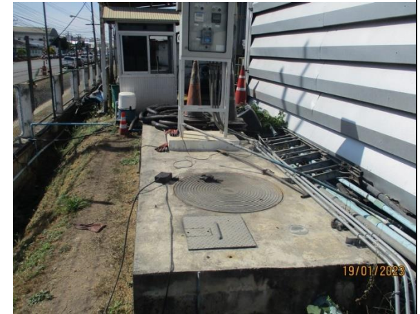
บ่อพักน้ำทิ้ง (ก่อนระบายไปยัง Sump pit 4)

รูปที่ 2-7 บ่อพักน้ำทิ้งภายหลังการบำบัดน้ำเสียภายในโรงงานแล้ว ทั้ง 5 บ่อ