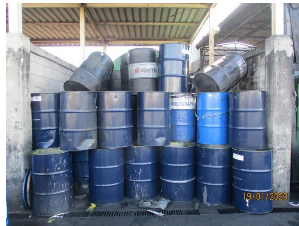
รูปที่ 2-24 ภาชนะปนเปื้อน รวบรวมภายในโรงเก็บขยะ