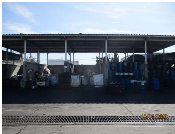
รูปที่ 2-10 โรงพักขยะเพื่อจัดเก็บของเสีย