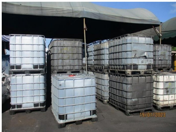
รูปที่ 2-19 ถังเก็บสำรองความจุ 1,000 ลิตร จำนวน 24 ถัง