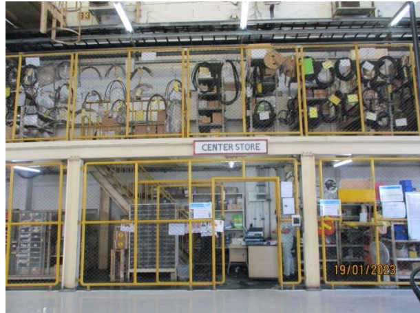
รูปที่ 2-8 อะไหล่หรืออุปกรณ์/เครื่องมือที่ใช้ในระบบบำบัดน้ำเสียสำรอง