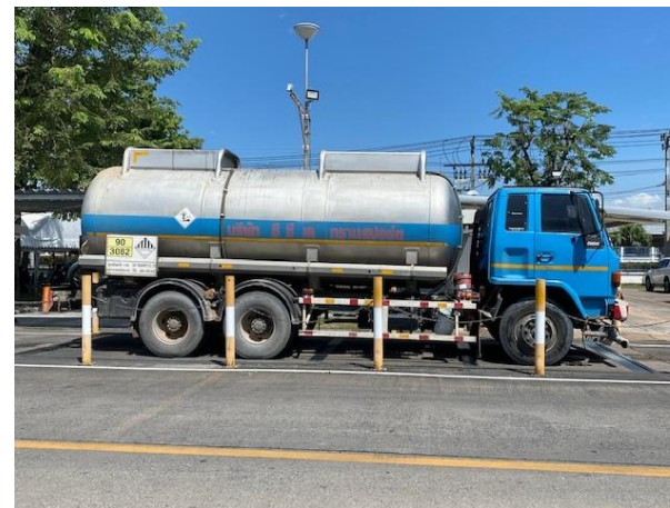
รูปที่ 2-12 รถขนส่งกากของเสียอุตสาหกรรม