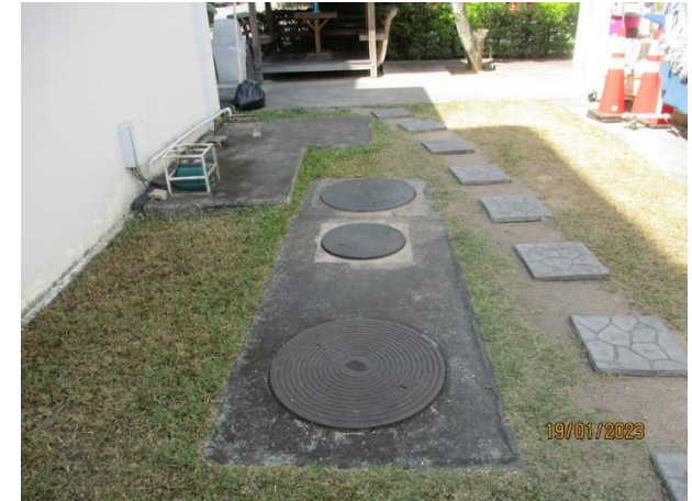
รับน้ำเสียจากห้องน้ำ-ห้องส้วมสำนักงาน