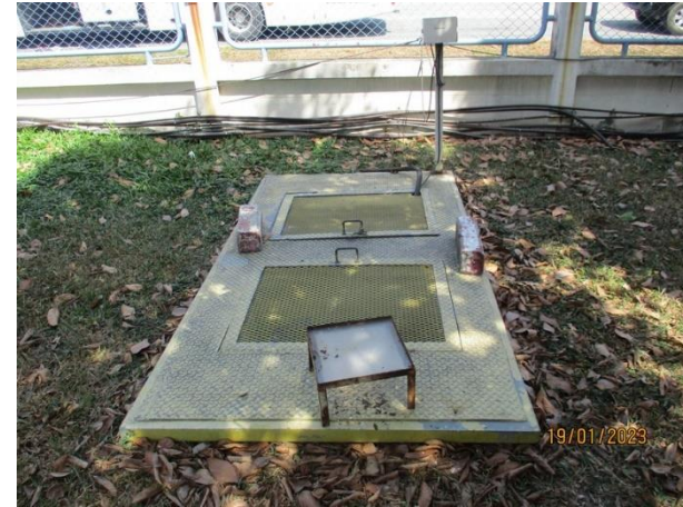
Sump pit 2