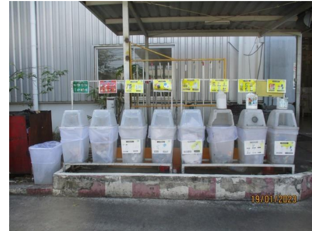
รูปที่ 2-9 ถังรองรับขยะมูลฝอย 3 ประเภท ได้แก่ ขยะทั่วไป ขยะอันตราย และขยะรีไซเคิล โดยถังขยะรีไซเคิลแยกออกเป็น 6 ประเภท