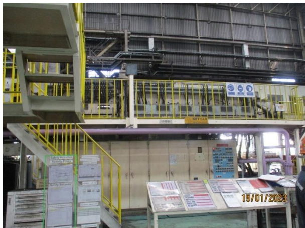
รูปที่ 2-30 แยกพื้นที่ระหว่างพนักงานและเครื่องให้ความร้อนเหล็กท่อน โดยติดตั้งเครื่องจักรบนชั้นลอย