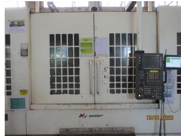
รูปที่ 2-48 เครื่องจักร CNC มีระบบ Interlock กรณีเครื่องจักรทำงานจะทำการปิดประตูอัตโนมัติ