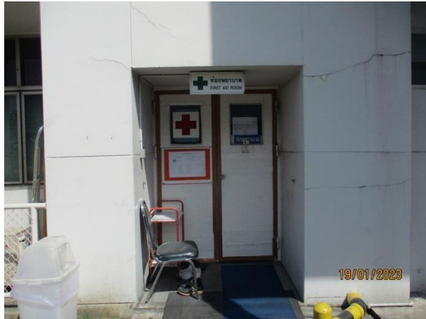
ห้องพยาบาล