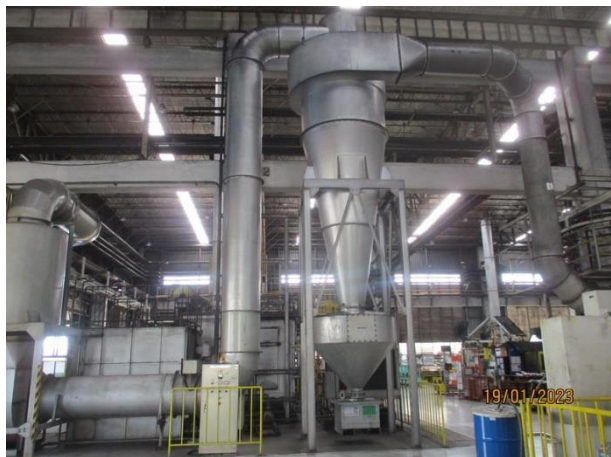
รูปที่ 2-1 ระบบบำบัดมลพิษทางอากาศแบบไซโคลนเพื่อบำบัดมลพิษทางอากาศ ที่เกิดจากเครื่องทุบขึ้นรูปขนาด 6300 ตัน