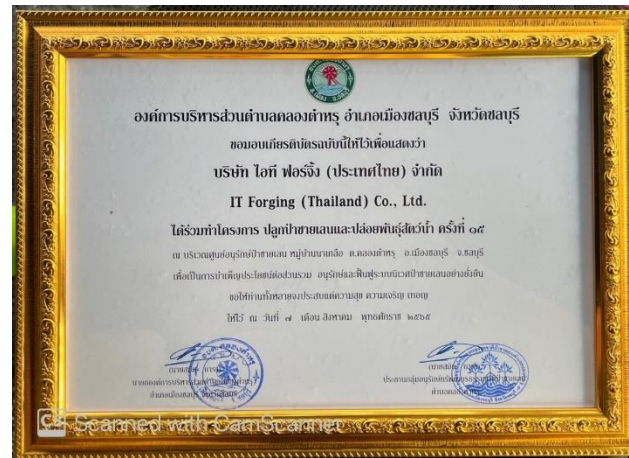
โครงการ ปลูกป่าร่วมฮีตัก้า