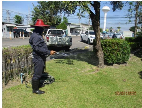
รูปที่ 2-57 การดูแลรักษา ใส่ปุ๋ยบำรุงดิน และต้นไม้