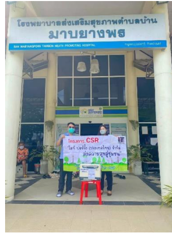
โครงการ มอบวัคซีน รพ.สต.มาบยางพร