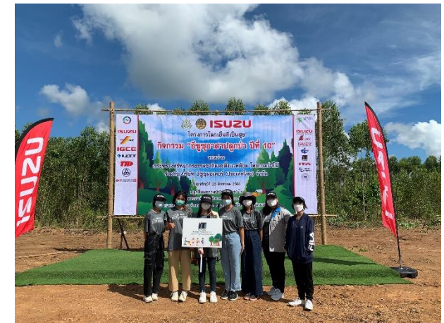
โครงการ ปลูกป่าร่วมอีซูซุ

รูปที่ 2-53 กิจกรรมส่งเสริมความสุขสู่ชุมชน