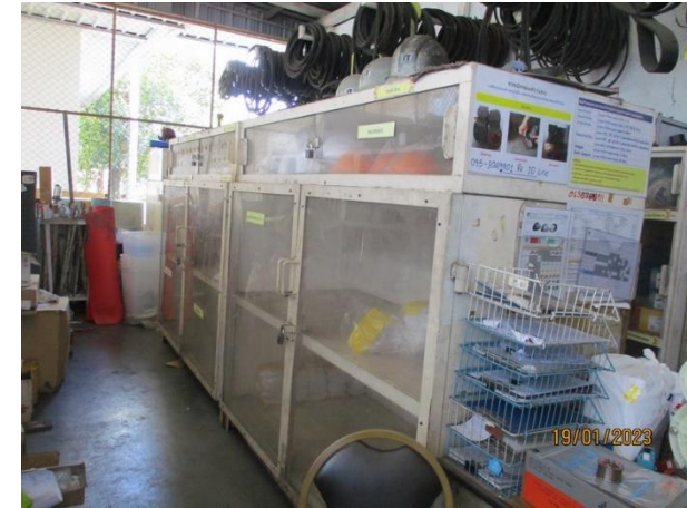
รูปที่ 2-44 สติกเกอร์อุปกรณ์ป้องกันอันตรายส่วนบุคคล