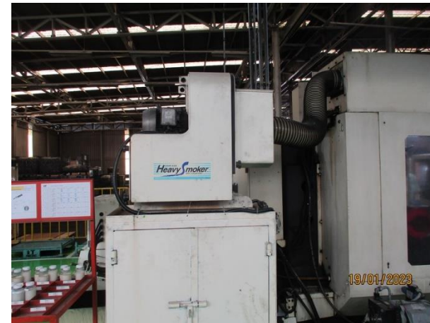
รูปที่ 2-40 ชุดกรองอากาศภายในเครื่อง CNC