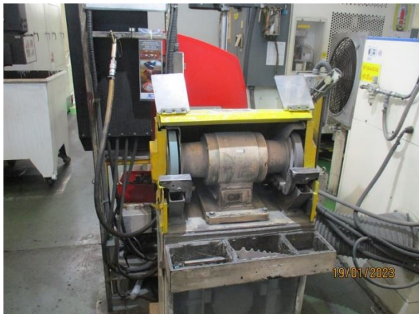
รูปที่ 2-41 พัดลมดูดอากาศเฉพาะที่ในจุดเชื่อม/ตัด