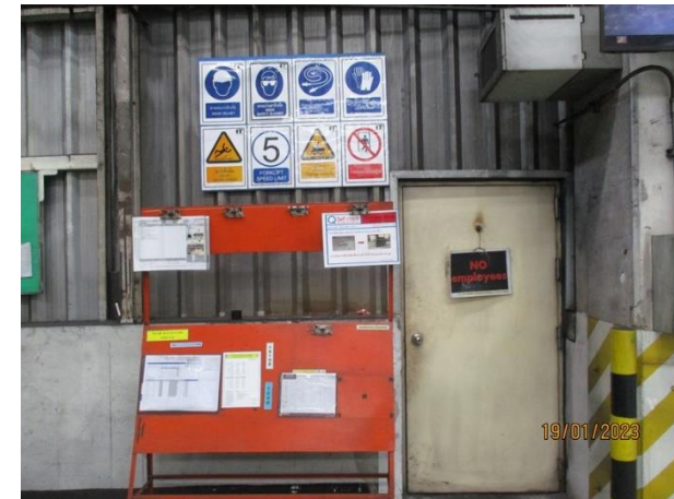
รูปที่ 2-45 ติดตั้งป้ายเตือนหรือสัญลักษณ์ประเภทอุปกรณ์ป้องกันอันตรายส่วนบุคคลที่ต้องสวมใส่บริเวณหน้าประตูทางเข้าบริเวณปฏิบัติงาน