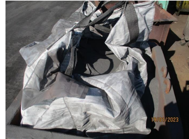
ฝุ่นจากระบบบำบัดมลพิษทางอากาศแบบ Cyclone