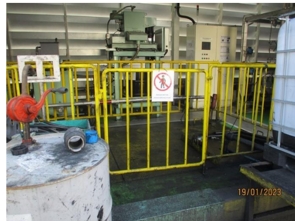
รูปที่ 2-20 บ่อคอนกรีตเก็บน้ำมันปนเปื้อนน้ำหล่อเย็น