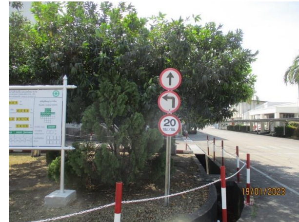
รูปที่ 2-28 ป้ายควบคุมความเร็ว