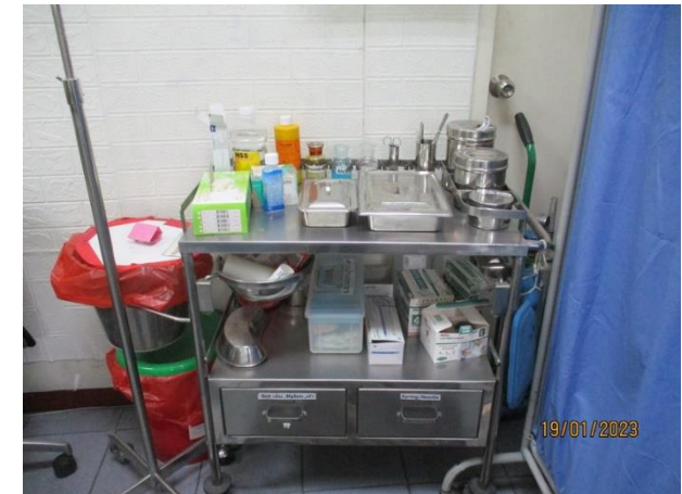
รถเข็นเครื่องมือแพทย์