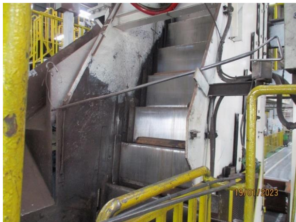
รูปที่ 2-34 ชั้นพักชิ้นงานในการลำเลียงเหล็กท่อนของสายพานลำเลียงที่ไหลเข้าสู่ห้องอบให้ความร้อน